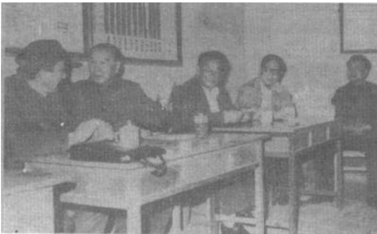
本版责任编辑 刘宪义

水井13眼,全乡19个行政村村的照明电网已基本形成,农田灌溉电力已初具规模。同时,他们还努力做好优抚工作,投资5万元,建起了敬老院,收养孤寡老人22名。对54名“五保”老人每人每年供给275公斤面粉和550元钱,使他们的生活水平高于当地一般群众的实际生活水平。党为群众办实事,群众一心跟党走。去年,全乡仅用3天就完成了全年的提留任务,8天就完成了全乡92万公斤夏粮征购任务,收粮场所出现了争交公粮的动人情景。(刘波)