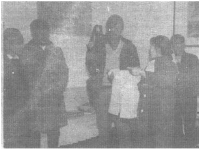
军屯村干部全心全意帮群众致富